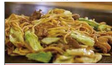
ひるぜん焼きそば