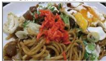
長田ぼっかけ焼きそば