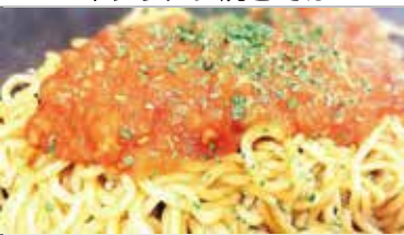
イタリアン焼きそば