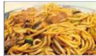
津山ホルモンうどん