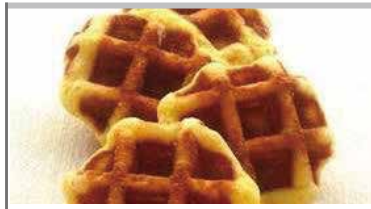
ベルギーワッフル