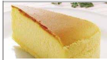
ベイクドチーズケーキ