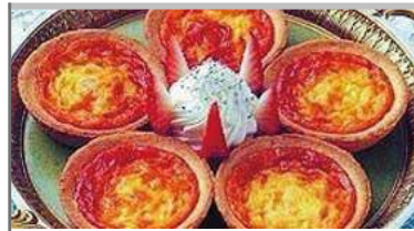
焼きプリンタルト