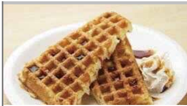
アメリカンワッフル